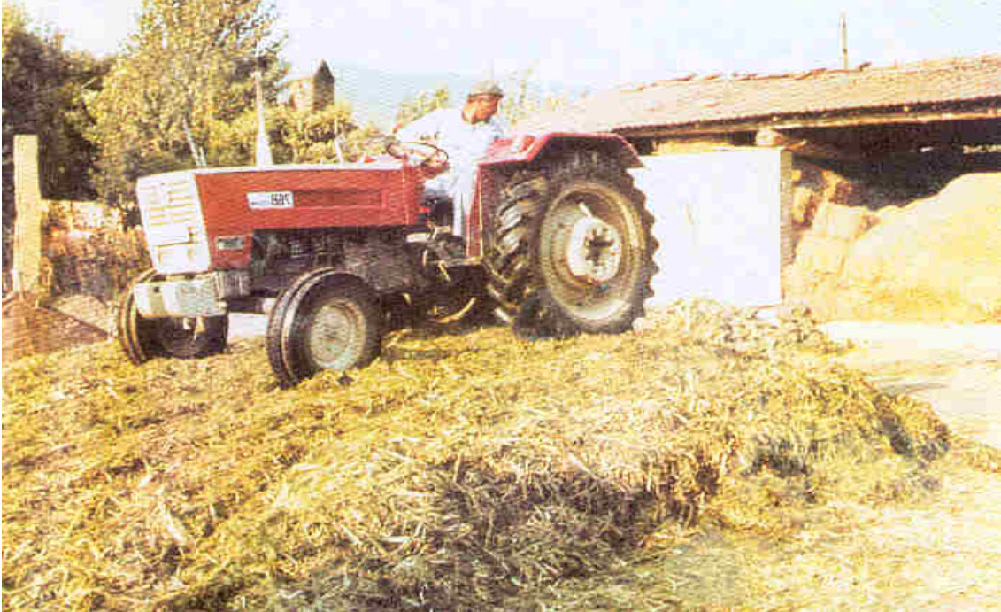
Silajın traktörle iyice sıkıştırılması

Silaj yapımında tahıllar (mısır, arpa, yulaf, buğday vb.) kullanılacaksa danelerin süt olumunu tamamlayıp, hamur olumu devresindeki dönemde hasat edilmelidir. Fiğ, yem bezelyesi gibi baklagiller kullanılacaksa, tam çiçeklenmeden sonra bakla teşekkülü zamanı hasat yapılmalıdır. Yonca 1/10 çiçeklenme devresinde hasat edilmelidir. Hasat edilen bitkiler vakit kaybetmeden silo çukuruna götürülmelidir.