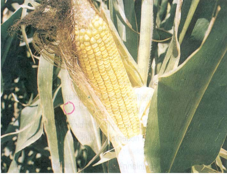
Silaj için hasat olgunluđuna gelmiř mısır bitkisi.